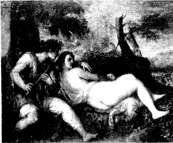
Titiano, La ninfa y el pastor (Viena, Kunsthistorisches Museum).

En el Kunsthistorisches Museum de Viena se conserva una obra tardía de Tiziano –que alguien definió como su “última poesía” y casi una despedida de la pintura–, conocida como La ninfa y el pastor . Las dos figuras están representadas en primer plano, inmersas en un oscuro paisaje campestre: el pastor, sentado de frente, tiene entre las manos una flauta, como si apenas la hubiera despegado de los labios. La ninfa, desnuda, representada de espaldas, está tendida cerca de él, sobre una piel de pantera, tradicionalmente símbolo de desenfreno y libidíne, exhibiendo las amplias caderas resplandecientes. Con un gesto un poco rebuscado, ella dirige su cara absorta hacia los espectadores y con la mano izquierda roza apenas su otro brazo como en una caricia. Un poco más allá, un árbol fulminado, mitad seco y mitad verde, como el de la alegoría de Lotto, 76 sobre el que se trepa dramáticamente un animal –una “cabra audaz”, según algunos, pero quizás un cervatillo–, casi a pastar las hojas. Aún más arriba, como a menudo en el último Tiziano impresionista, la mirada se pierde en un grumo encendido de pintura.